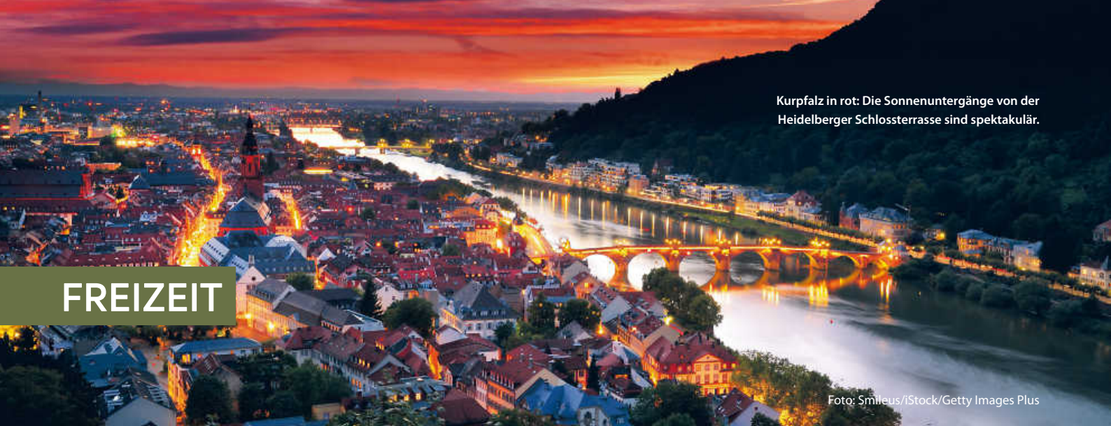
Kurpfalz in rot: Die Sonnenuntergänge von der Heidelberger Schlossterrasse sind spektakulär.