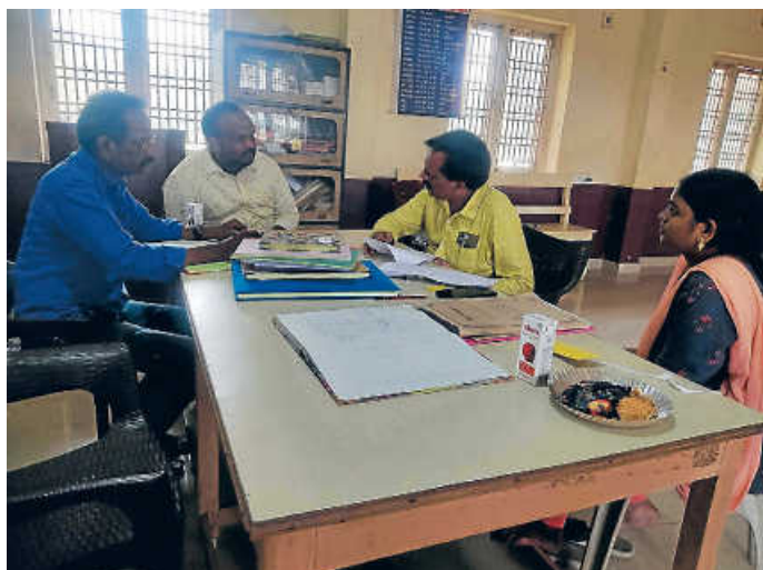
Besuch der indischen Aufsichtsbehörde in der Kinderarche

Herzlichen Dank für alle Ihre Unterstützung.