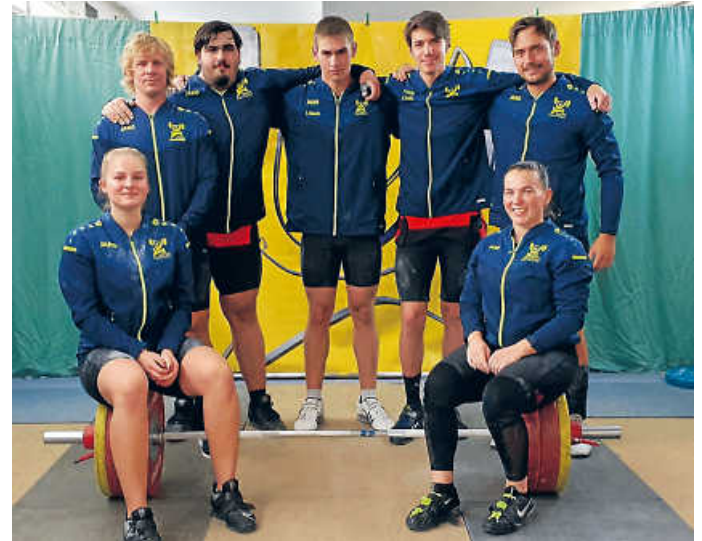
Obrigheims „Dritte“ erneut erfolgreich