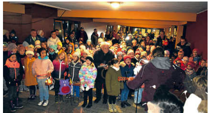
Ein farbenprächtiges Bild beim Martinsumzug