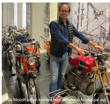
Als Motorradfan kommt hier durchaus Nostalgie auf.