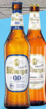
Bitburger Pils, alkoholfrei.