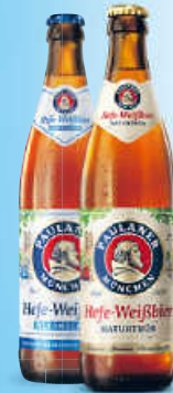
Paulaner Weissbier, Hell, Dunkel, Kristall, alkoholfrei.

je 20 x 0,5 l Preis/l € 1,10, Pfand € 3,50