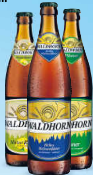
Waldhorn Pils, Export, Hefe oder Naturradler.

je 20 x 0,5 l Preis/l € 1,50, Pfand € 3,50