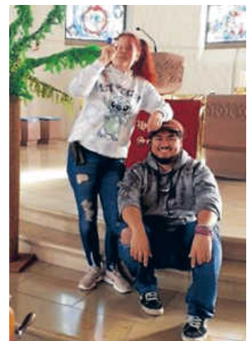
Duo Mütze und Zoomie