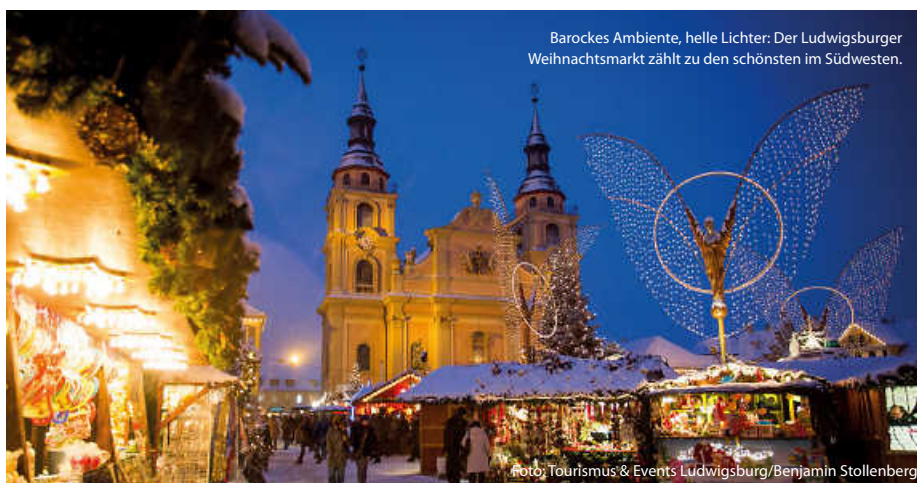
Barockes Ambiente, helle Lichter: Der Ludwigsburger Weihnachtsmarkt zählt zu den schönsten im Südwesten.

Oder kleine, liebevoll inszenierte Adventsmärkte in stimmungsvoller Kulisse, zum Beispiel im Maulbronner Klosterhof zum 2. Advent, oder der Adventsmarkt im Bruchsaler Schlosshof unter der erleuchteten Schlossfassade. Ein Besuch lohnt sich ... (jr/su/red)