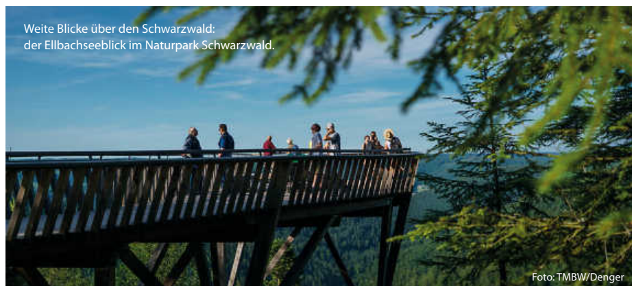
Weite Blicke über den Schwarzwald: der Ellbachseeblick im Naturpark Schwarzwald.

Schon von Weitem ist der Aussichtsturm im Naturpark Schönbuch zu sehen. Die 35 Meter hohe Holz-Stahl-Konstruktion auf dem Stellberg ragt weit über die umliegenden Bäume im ältesten Naturpark Baden-Württembergs hinaus. 348 Stufen erschließen den filigranen Turm und führen zu drei Aussichtsplattformen in 10, 20 und 30 Metern Höhe. Ganz oben kann man nicht nur dem Schönbuch auf sein Blätterdach schauen; auch die Schwäbische Alb und der Schwarzwald erscheinen von hier zum Greifen nah. (TMBW/red)