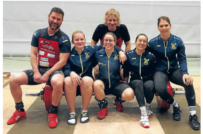
Die Zweite mit Sieg in Fellbach