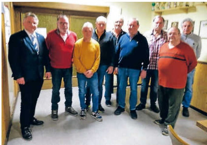
Der neue Vorstand