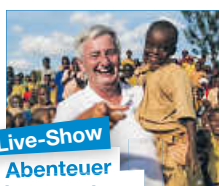
Live-Show Abenteuer Weltumrundung