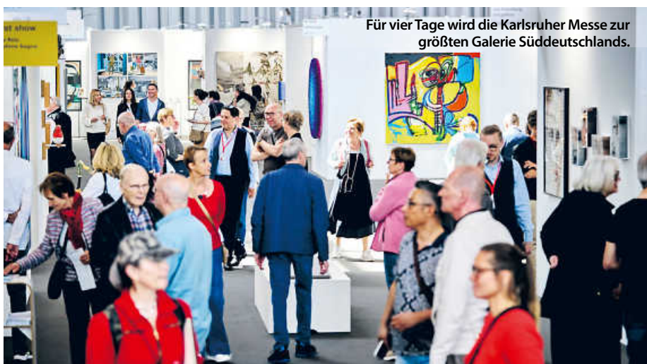
Für vier Tage wird die Karlsruher Messe zur größten Galerie Süddeutschlands.