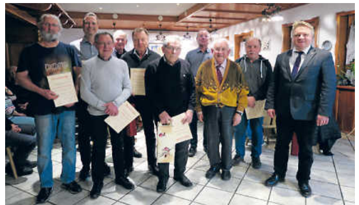
Ehrung langjähriger Mitglieder