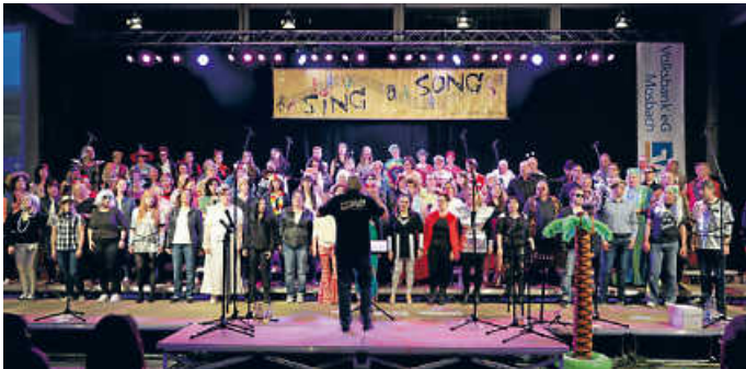
„Sing a Song“ - der große Rock- und Popchor