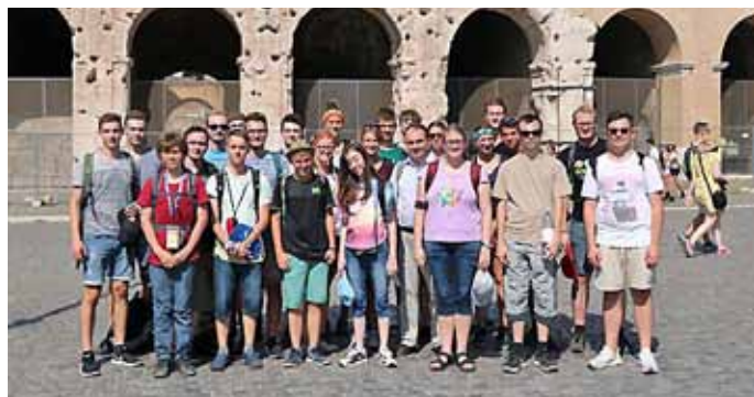
Gruppenbild der Minis vor dem Kolosseum

man gewöhnlich im Rahmen einer Romwallfahrt die 7 Hauptkirchen besucht, wurde diesmal das Programm erweitert und es wurden zusätzlich die 7 besten Eisdielei ausfindig gemacht.