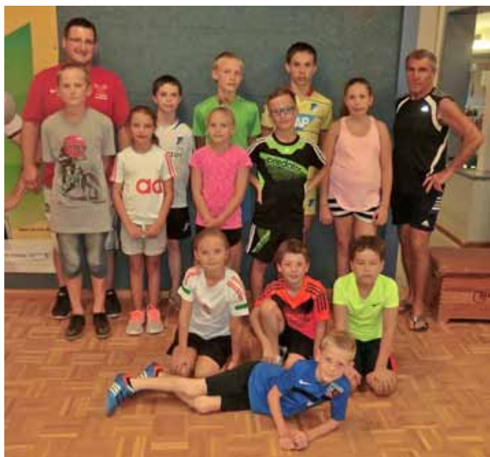
Die Teilnehmer am Ferienprogramm der Gewichtheber