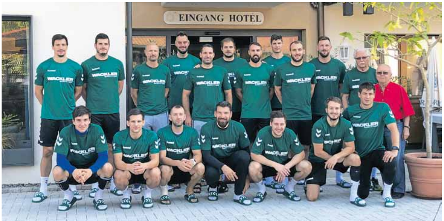
Ausgewert, aber zufrieden nach einem anspruchsvollen Trainingslager: die Mannschaft des Handball-Erstligisten.