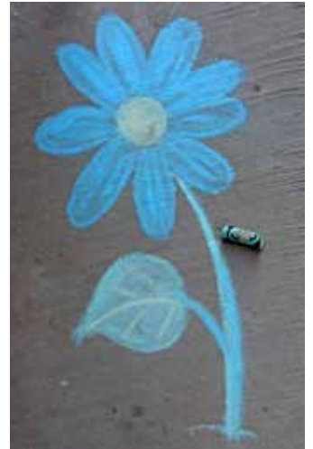
„Straßenblume“ mit Kreide auf Asphalt gemalt. Am Ende des Kiliansmarkt könnte die Bachstraße voll davon sein.

Wer also beim Projekt „Straßenmalerei“ aktiv malen, mithelfen oder Malkreide spenden möchte, möge sich bei uns melden - Kontaktdaten siehe „Die Werkstatt!“.