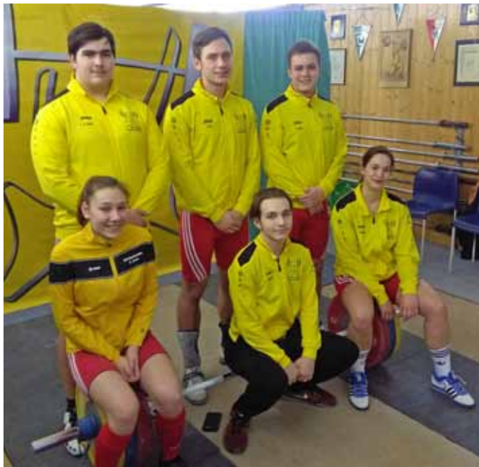
Die Dritte mit einem engagierten Wettkampf