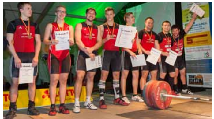
Mannschaft beim Finale

eigens aufgebauten 1.000-Mann-Zelt durchgeführte Veranstaltung entsprach bei Weitem nicht den vom Bundesverband geforderten örtlichen/technischen Gegebenheiten sowie materiellen Anforderungen. Nicht nur die Heber hatten unter den widrigen Bedingungen zu leiden, auch unsere Fans, die immerhin einen stolzen Eintrittspreis von 20 Euro bezahlt hatten, litten unter den klimatischen Bedingungen und mussten über 5 Stunden in einem kalten Zelt ausharren. gez. Abteilungsleitung