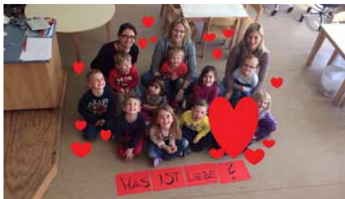
Wir suchen die Liebe

Nach der Kirche findet bei gutem Wetter ein Sektempfang statt. Wir laden alle ganz herzlich an diesem Tag in die Kirche ein.