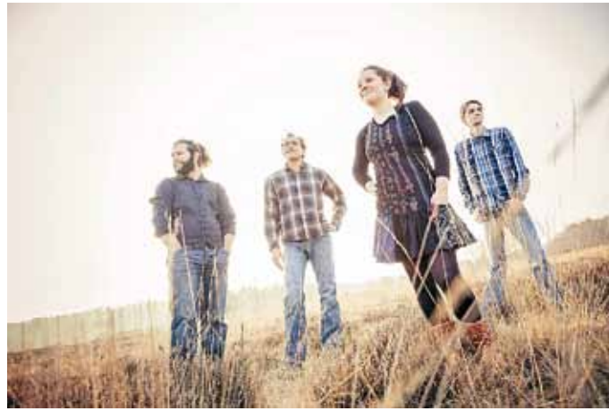
Die Band Crosswind eröffnet das Folk am Neckar Festival.

Die zweite Formation am Freitagabend kommt aus Irland, heißt Scannal und bietet etwas ganz Besonderes: eine fließende Mischung aus High Energy Traditionals, Technobeats, Chart-Hits, Rap - übergangslos vom einen ins andere. Keiner weiß, wie Scannal diese Live-Trad-Disco mit Pogo, Polka, La-Ola und Headbanging hinzaubern. Aber eines ist sicher: Am Ende tanzt die Oma mit dem Enkel, die Schwiegermutter mit dem