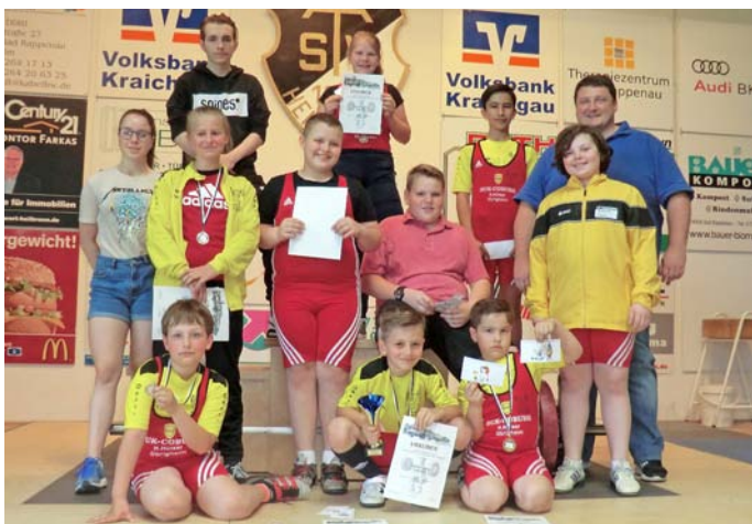
In Heinsheim erfolgreich