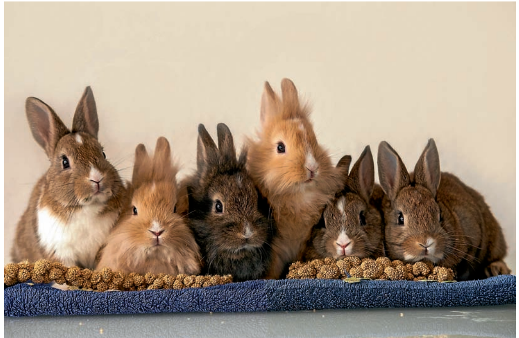
Kaninchen sind Cilli Siedls Lieblingsmotiv.

Schon seit frühester Kindheit interessiert sich Cilli Siedl für Tiere. Einige Jahre später kam ein weiteres Hobby hinzu, das sie bis heute begleitet: das Fotografieren. Rasch wurden die eigenen Tiere, vor allem Kaninchen, zu Cillis liebstem Fotomotiv. Auch die Tiere im weiteren Familienkreis wurden immer professioneller abgelichtet, bis schließlich auch Freunde und Bekannte ihr Haustier zu einem „Fotoshooting“ vorbeibrachten. So ist im Laufe von Jahren eine riesige Fotosammlung entstanden, die mittlerweile weit über 100.000 Aufnahmen umfasst. Aus ihnen wurde nun eine kleine Auswahl zusammengestellt. Den Schwerpunkt bilden