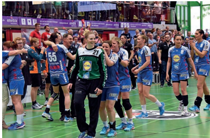
Riesensfreude über Sieg und Klassenerhalt.

Wie erwartet zeigten beide Mannschaften im Derby wieder ein extrem schnelles Spiel und Neckarsulm legte dabei direkt einen guten Start hin. Nach dem befreienden Sieg in Nellingen kämpften die Neckarsulmerinnen von Beginn an entschlossen für den Klassenerhalt und