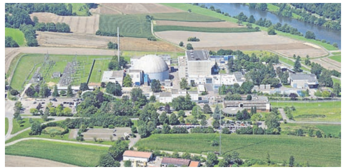
Kernkraftwerk in Obrigheim

Die EnBW wird die verbrauchten Brennelemente schrittweise in insgesamt 15 Castor-Behälter überführen und darin sicher verschließen. Pro Schifftransport sollen drei Castoren nach Neckarwestheim gebracht werden, so dass voraussichtlich mit insgesamt fünf Transporten zu rechnen ist. Diese fünf Transporte sollen möglichst alle im Jahr 2017 durchgeführt werden. Aus der Genehmigung ergibt sich, dass die EnBW und das beteiligte Transportunternehmen die Transporttermine nicht bekanntgeben dürfen. Die EnBW wird allerdings parallel zu den Transporten die Öffentlichkeit über den Verlauf des Vorhabens informieren und hierfür unter ande-