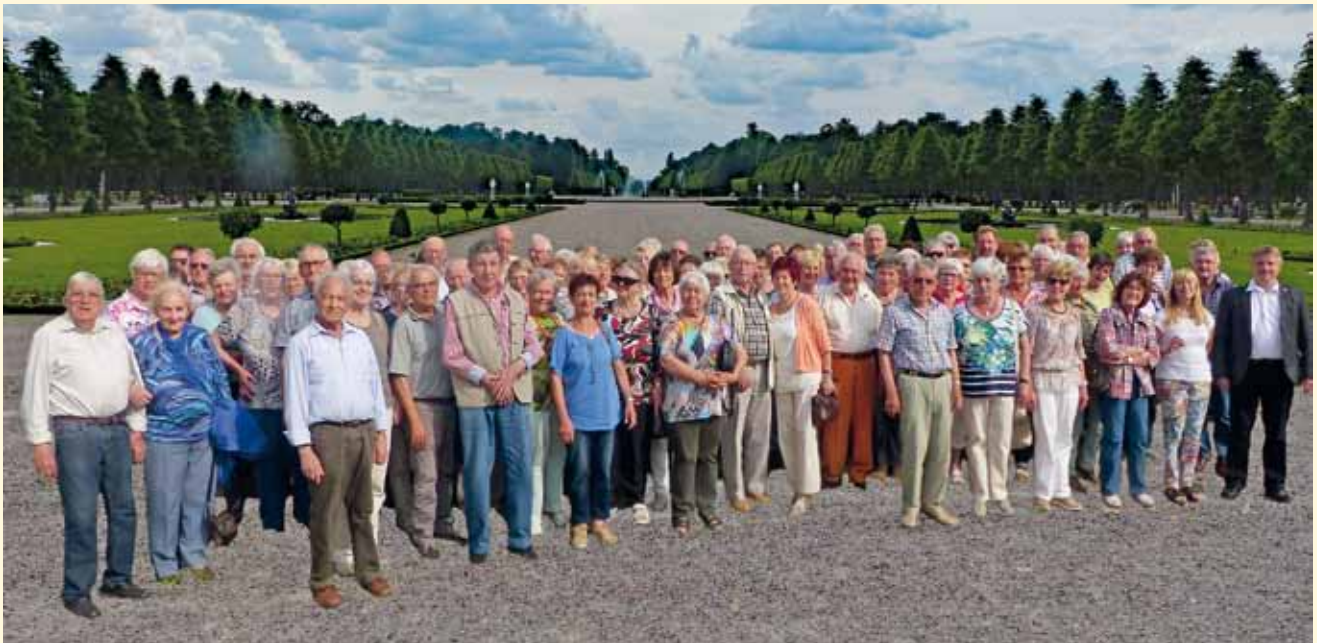
Die Teilnehmer mit Schlossgarten

Die Gemeinde Obrigheim und der Seniorenbeirat hatten zu einer Halbtagesfahrt nach Schwetzingen mit der Besichtigung des Schlosses und des Schlossgartens eingeladen. Bei sehr informativen Führungen durch die Räumlichkeiten des Schlosses erfuhren die Senioren viel Historisches über die malerische Sommerresidenz des Kurfürsten Carl Theodor von der Pfalz und konnten anschließend bei herrlichem Son-