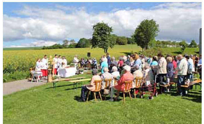
Feldmesse beim Pfarrfest in Asbach