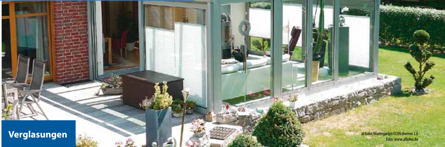
al bohn Wintergarten ECON thermo 3.0