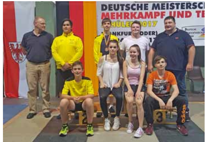
Obrigheimer Sieger in der Vereinswertung