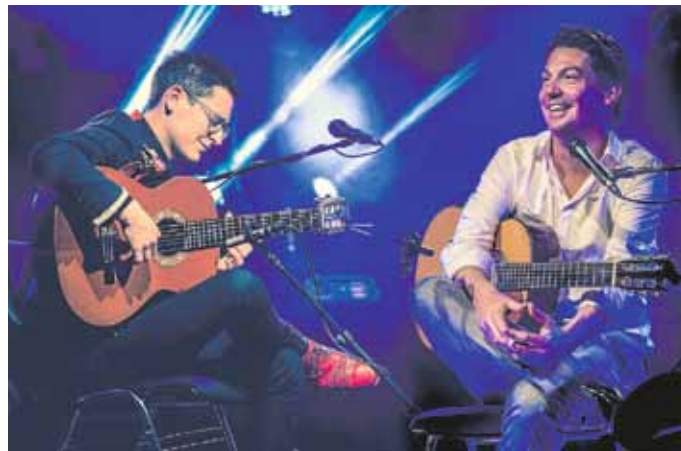
Das Duo „Café del Mundo“

Weiter geht es am 22. Juli mit dem 4. Mosbacher Sambafestival „MobaCabana“. Es präsentieren sich verschiedenste Sambagruppen aus ganz Deutschland. Mit dabei sind in diesem Jahr unter anderem die Sambanditos, Tropamin, Samba Brasilikum und