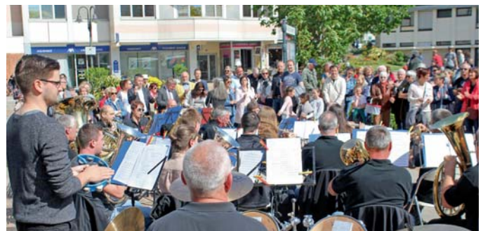
Platzkonzert in Chantepie

Beim gut besuchten Platzkonzert unserer diesjährigen Frankreichfahrt konnte man sehr gut erkennen, dass der Musikverein in Chantepie einen hohen Bekanntheitsgrad genießt. Fröhliche Musiker sorgten bei fröhlichen Zuhörern für fröhliche Stimmung - und genau diese Stimmung können Sie am diesjährigen Dorffest beim Musikverein Asbach erleben. Wir freuen uns auf Ihren Besuch und laden Sie ein das Dorffest beim Musikverein Asbach mit unterhaltsamer Musik, gutem Essen und angenehmen Gesprächen zu genießen. Ihr Musikverein Asbach