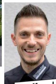
Steffen Hecht Bauelemente-Service