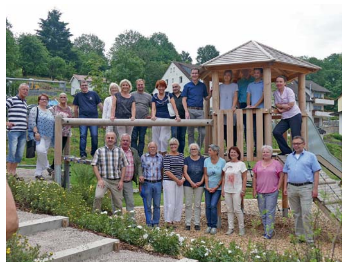
Treff- und Bewegungspark am Mühlbach, Billigheim-Waldmühlbach