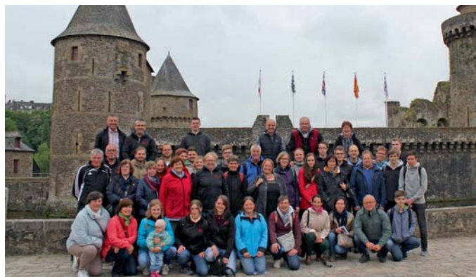
Die Reisegruppe in der Festungsanlage Fougères