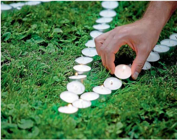
Am Samstag, 14. Juli, wird das Lichterfest eröffnet.