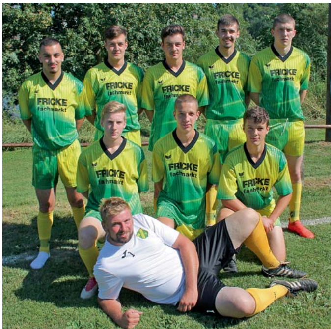
Das siegreiche Ü16-Team „Energie Kopfnuss“

Die Vorstandschaft bedankt sich daher herzlich bei allen Gästen, bei allen fleißigen Helferinnen und Helfern, ohne die ein Fest in dieser Größenordnung nicht zu stemmen wäre, und bei den zahlreichen Spendern, von den Kuchenbäckerinnen bis zu den Geldgebern.