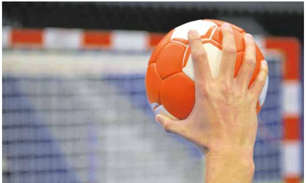
Göpping pflegt Kooperationen mit weiteren Handballvereinen der Region, um dem Nachwuchs eine optimale Förderung ermöglichen zu können.

Der Verein erhält das Jugendzertifikat seit 2011 bereits zum siebten Mal, was zeige, dass Göppingen zu einer der Top-Ausbildungsadressen des deutschen Handballs zähle, so die Göppinger in einer Pressemeldung.