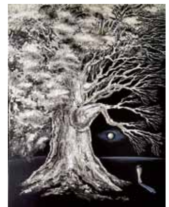
Black & White

Bei der Wahl der Bildmotive gibt es kaum Beschränkungen. Realistische Darstellung ist genauso aktuell wie abstrakte Formen oder Liniensprache. So wie ein Fluss nicht stehen bleibt und weiter fließt, übernimmt die Kunst die Vielseitigkeit der