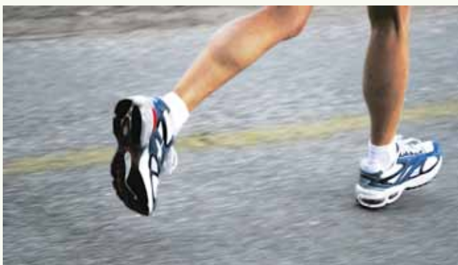
Seit Dezember können sich interessierte Sportler zum Stuttgart-Lauf anmelden.