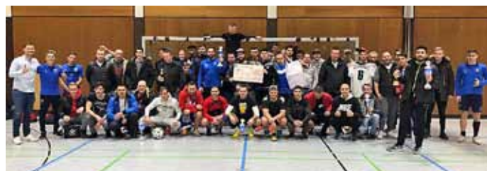
Gruppenbild nach Siegerehrung