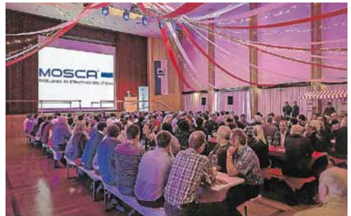
Ausgelassene Stimmung auf der Mosca-Weihnachtsfeier: Die Mitarbeiter hatten nach einem erfolgreichen Jahr allen Grund zu feiern.

Mosca verdankt seine Erfolgsgeschichte vor allem den hervorragend geschulten Mitarbeitern. Daher investiert das Familienunternehmen in diesem Jahr stark in die Ausbildung seiner Angestellten: In der neuen ‚Junior-Fabrik‘ werden Azubis künftig noch intensiver auf ihrem beruflichen Werdegang betreut. Weitere Investitionen stehen an den beiden Standorten des Unternehmens, Muckental und Waldbrunn, an. Zudem stellt Mosca sein Serviceangebot im After-Sales-Bereich neu auf und bietet mit ‚ONE Service‘ ab 2018 einen weltweit einheitlichen Rund-