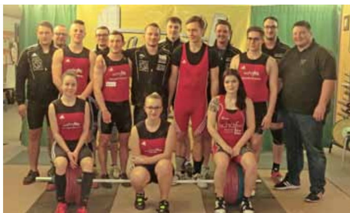
Vereint: Die Heber aus Obrigheim und Flözlingen