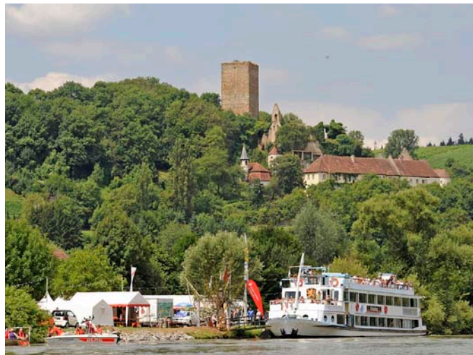
Schiffsanlegestelle bei Heinsheim unterhalb der Burg Ehrenberg

Zwei Tage lang können die beteiligten Orte per Schiff besucht werden. Am Neckarufer von Gundelsheim, Bad Rappenau-Heinsheim, Bad Wimpfen und Bad Friedrichshall warten Feste und Attraktionen, die zum Verweilen am Neckarufer einladen. Floßrennen, kuriose Fahrzeuge wie schwimmende 2-CV-Enten, Modellboote und –schiffe, Mitmachaktionen wie Schnupperrudern, Bungeetrampolinspringen, ein abwechslungsreiches Kinderfest oder Hubschrauber-Rundflüge übers Neckartal - an den Haltepunkten wird ein buntes Programm geboten. Den Höhepunkt bildet am Samstagabend der Schiffskorso mit Musik, Tanz und Feuer-