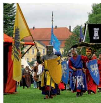
Aufmarsch zum Ritterturnier

den, Seifensieder, Korbflechter und etlichen anderen Handwerkern können die Besucher bei der Arbeit zusehen, bei den Steinmetzen sogar selbst einmal mit Hammer und Meißel aktiv werden. Schupfnudel-, Crêpes-, Falafel- und Flammfisch-Stände, der berühmte „Heureka-ner“, gezupfte Sau, Goldlocken oder Wild-Burger helfen bei der Bekämpfung aufkommenden Hungers, der Durst kann mit Bier, Met, Beerenweinen, orientalischen Tees oder sogar profanem Wasser gelöscht werden. Rund 25 Lagergruppen mit zusammen weit über 200 Darstellern lassen die Zeit der Wikinger, der Kreuzzüge, des Minnesangs, der Turniere oder der Landsknechte auferstehen. Auch hier gibt es jede Menge Handwerk zu sehen, das Würzburger Greifenpack demonstriert zwei Mal täglich auf unter-