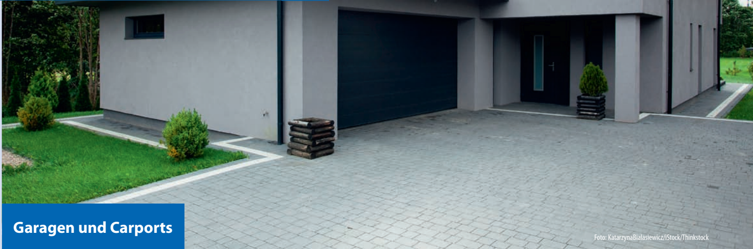
Garagen und Carports