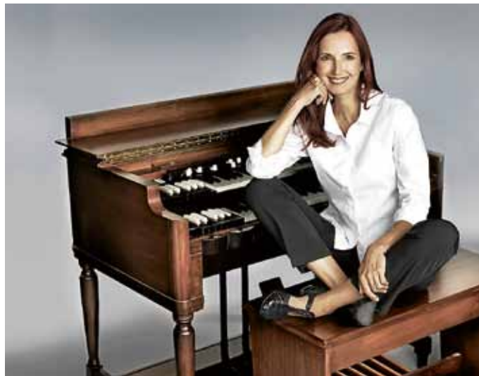
Die renommierte Orgelvirtuosin Barbara Dennerlein gastiert mit ihrem Programm „Spiritual Moments“.

Die musikalische Vielfalt Barbara Dennerleins hängt mit ihrem Geschmack, ihrem Talent und ihrer Souveränität auf dem Instrument zusammen. Barbara Dennerleins CDs wurden mit Auszeichnungen bedacht, mehrfach mit Jazz Awards und dem Preis der Deutschen Schallplattenkritik. Ihre CD „Take Off“ erreichte sogar Platz 1 der Jazz-Charts und wurde als meist-