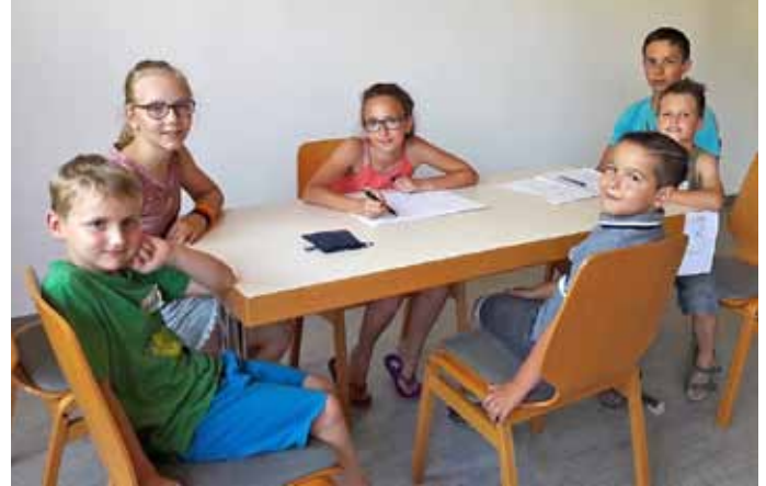
Die Köpfe rauchen