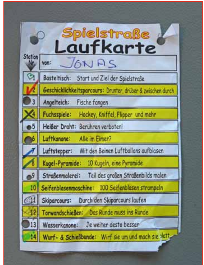
Eine der Laufkarte mit den 14 abgestempelten Spielstationen