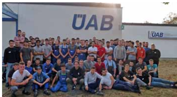
Die neuen Auszubildenden des Ausbildungsjahres 2018/19

„Neben den fachlichen Fertigkeiten und Kenntnissen sind es insbesondere auch soziale Kompetenzen, die zum Ausbildungserfolg beitragen“, so Jürgen Weiß. Ein ÜAB-Teamtraining zum Ausbildungsbeginn fördert diese Fähigkeiten. Beste Bedingungen also für die neuen Auszubildenden, sich in ihren Berufen zu qualifizieren und damit die Basis für einen erfolgreichen Abschluss ihrer Ausbildung zu legen.