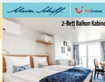
2-Bett Balkon Kabine