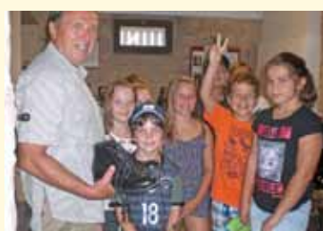
Besuch im Heimatmuseum mit dem Heimatverein