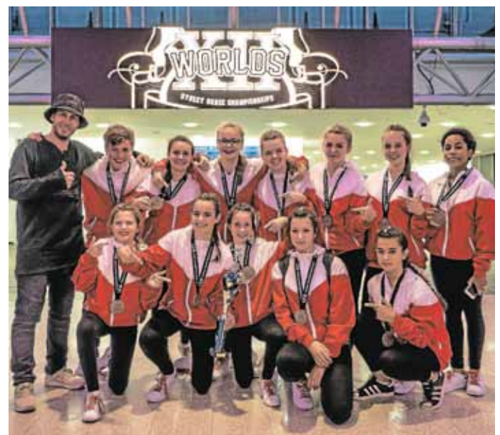
Die Gruppe „So What“ ertanzte sich den sechsten Platz.

sie mit Medaillen und Pokalen belohnt, die nun ab sofort die Vitrinen der Tanzschule zieren werden.