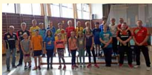
Tischtennis-Weltmeisterschaft beim SVO, Abt. Tischtennis