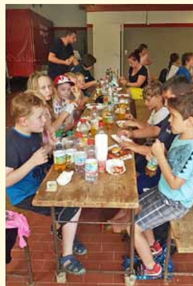
Spielnachmittag bei der Freiw. Feuerwehr, Abt. Obrigheim