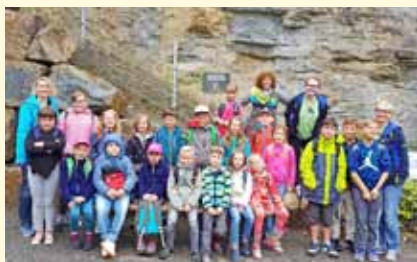
Besuch Tropfsteinhöhle in Eberstadt mit dem SVO, Abt. Turnen

an die Eltern. Es hat in diesem Jahr hervorragend geklappt mit den Abmeldungen, falls ein Kind kurzfristig verhindert war. So konnte dafür ein anderes Kind aus der Warteliste nachrücken. Nochmals „vielen, vielen Dank“ allen teilnehmenden Vereinen. Hier eine kleine Bildernachlese von den uns überlassenen Bildern: