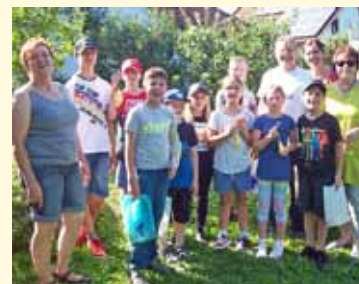
Besuch beim Imker: Alles über Bienen mit den Freien Wählern