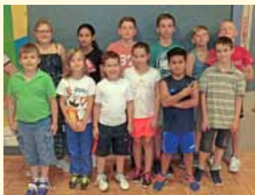
Ein Nachmittag bei den Gewichthebern mit dem SVO, Abt. Schwerathletik