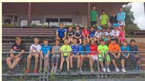
Tennistraining beim Tennisklub „Blau-Weiß“ Asbach