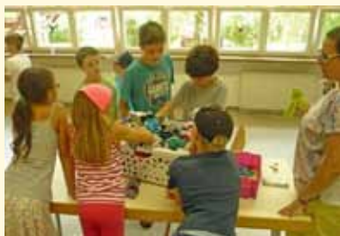
Spiel und Spaß beim Evang. Kirchenchor Mörtelstein