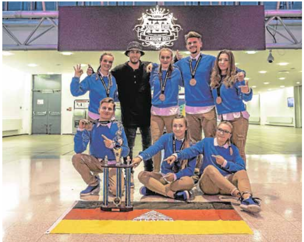
Bronze für die „Stracxs-Crew“ bei der WM in Glasgow.

Dadurch hatten sie den Samstag „frei“ - ließen sich jedoch nicht viel Zeit zum Ausruhen, sondern trainierten weiter, besuchten Workshops und bereiteten sich aufs Finale vor. Die amtierenden deutschen Meister der Crew „So What“ (Kategorie Under 18 Novice) mussten samstags nochmal auftreten, qualifizierten sich dann aber auch für das Finale. Für die „Stracxs Crew“ kam dann