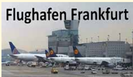
Besuch Frankfurter Flughafen mit der AWO