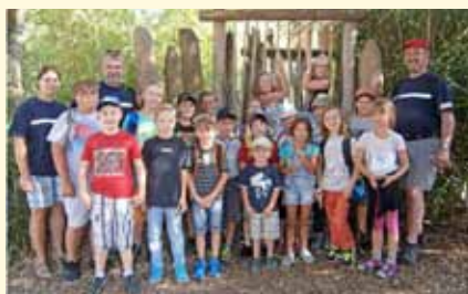
Besuch im Zoo Heidelberg mit der Freiw. Feuerwehr, Abt. Mörtelstein