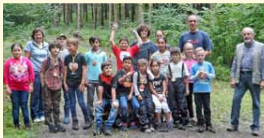
Schatzsuche im Kirstetter Tal mit der Ideen-Schmiede