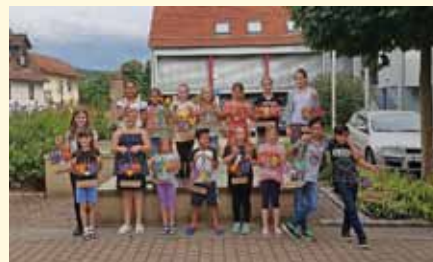
Wir basteln ein Türschild bei der Hobby-Gemeinschaft Obrigheim