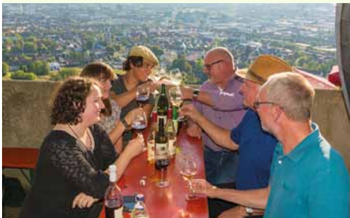
Das Weinlesefest in Heilbronn - eine unterhaltsame Veranstaltung