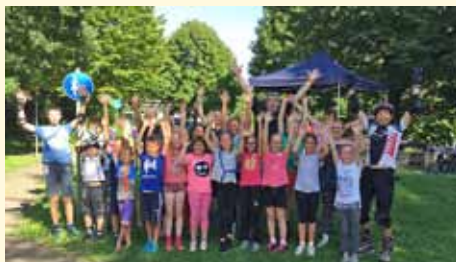
Inlinerkurs - richtig fallen und bewegen mit dem Ski-Club