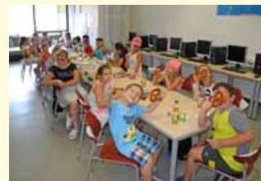
Lesezeichen basteln und Zencolor-Ausmalbilder basteln in der Schul- und Gemeindebücherei