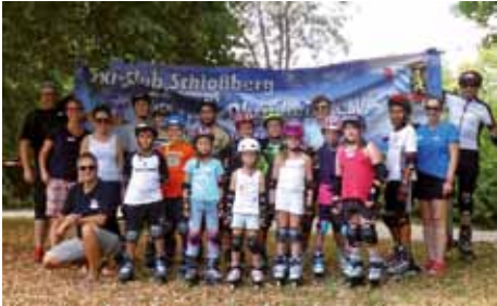
Ski-Club OBH - Inlinerkurs