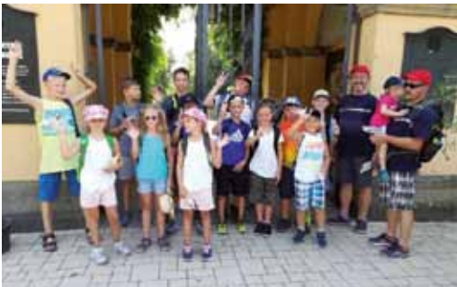
FW Mörtelstein - Besuch Zoo Heidelberg