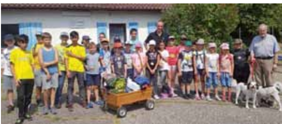
Ideen-Schmiede -Schatzsuche KIRSTETTER Tal