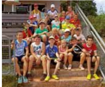
Tennisklub Asbach -Tennistraining