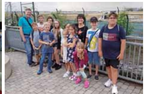
AWO OBH - Besuch Frankfurter Flughafen