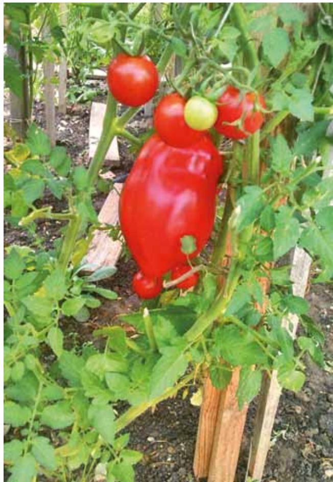
(Text: cpJ)

Extreme Temperaturen, lange extreme Trockenheit und mangelnde Ernteerträge als Folge. Doch auch extrem groß gewachsene Früchte und Gemüse sind eine Besonderheit des extremen Sommerwetters, wie das Bild der Riesentomate zeigt, das in einem Garten im Obrigheimer Finkenweg aufgenommen wurde.