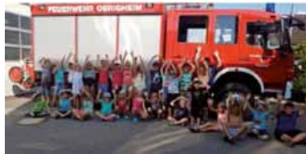
FW OBH - Spiel + Spass