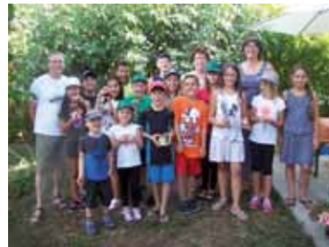
Freie Wähler OBH - Beim Imker