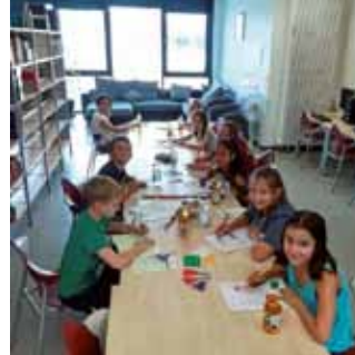
Bücherei - Basteln und Malen