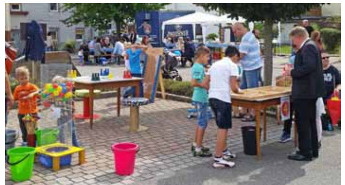
Vier der sieben „Fuchsspiele“ an der Spielstation Nr. 4