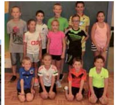
SVO - Nachmittag bei den Gewichthebern