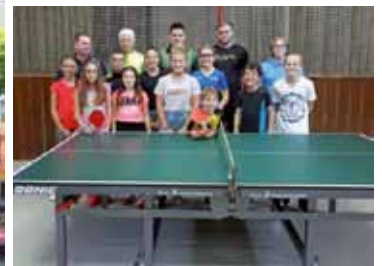
SVO - Tischtennis-Genauigkeit