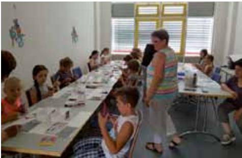
Hobbygem. OBH - Basteln