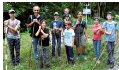
Ideen-Schmiede - Wanderung Luttenbachschlucht