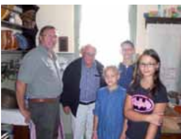
Heimatverein - Im Heimatmuseum