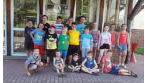
Ev. Kirchengem.Mört. - "Schlag den Raab"