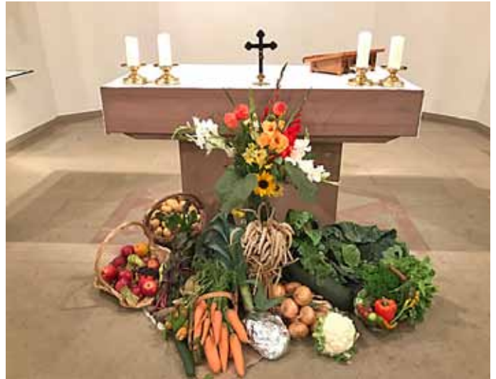
Erntedankaltar in der Filialkirche St. Maria, Asbach

Am letzten Wochenende haben wir in allen Kirchen das Erntedankfest gefeiert. Mit viel Sorgfalt und Liebe wurden die Erntedankfestgebäude gebaut. Das Bild zeigt jenen in der Filialkirche St. Maria. Auf unserer Homepage sind weitere zu sehen.