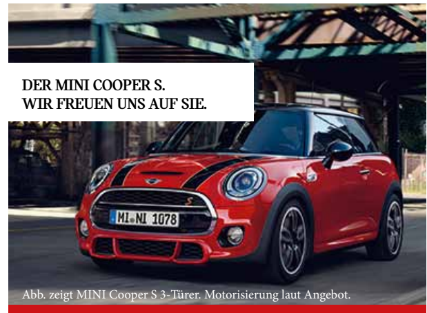
DER MINI COOPER S. WIR FREUEN UNS AUF SIE.