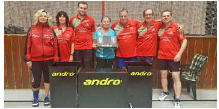
Die erfolgreiche 2. Tischtennismannschaft