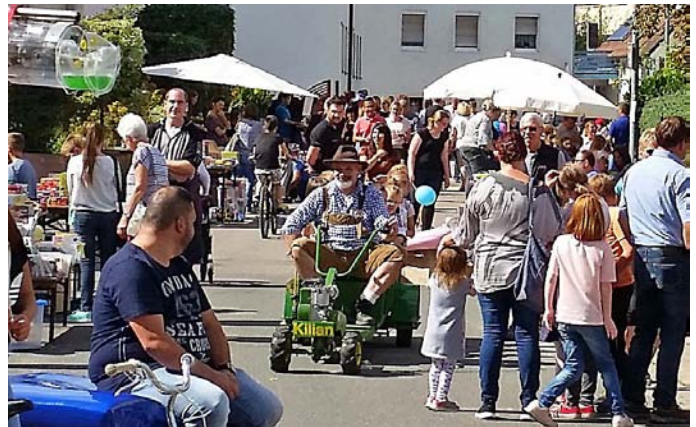
Flohmarkt in der Bachstraße. Zeitweilig war hier für das Kiliansbähnle kaum ein Durchkommen.