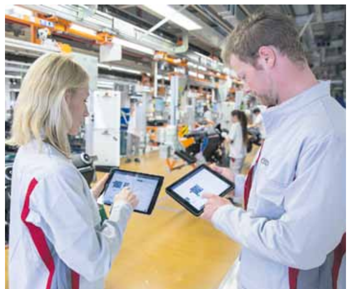
Der digitale Planungsassistent erleichtert bei Audi künftig Produkt- und Fertigungsplanern die Arbeit. Die App ermöglicht erstmals den Zugriff auf eine einheitliche, immer aktuelle Datenbasis und sorgt so für eine vernetzte, standort- und bereichsübergreifende Zusammenarbeit.

serienreife Anwendung zu entwickeln und diese bei Audi künftig flächendeckend einzusetzen.