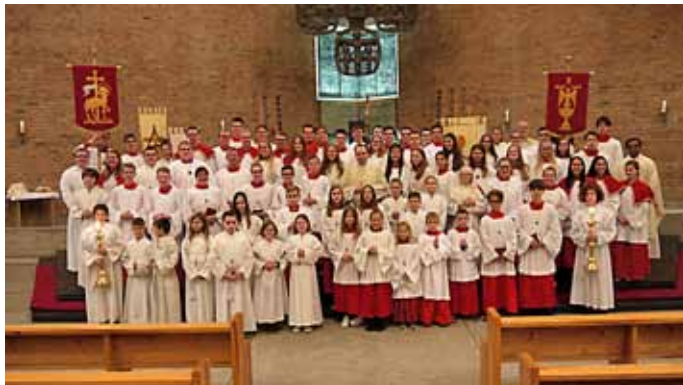
Gruppenbild der 80 Ministranten in der Vorabendmesse in Aglasterhausen