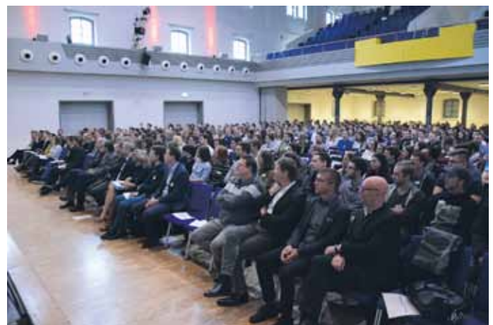
Von den 1100 neuen Studierenden am Campus Mosbach wurde rund die Hälfte feierlich in der Alten Mälzerei begrüßt.

en Studierenden zudem von den Vertretern der Städte und Landkreise, der Studierendenvertretung und des Studierendenwerks sowie der aim Akademie. Anschließend nahmen die Studiengangsleiter und Studierende aus älteren Jahrgängen die Erstis in Empfang, zeigten ihnen den Campus und erklärten den Studienablauf.