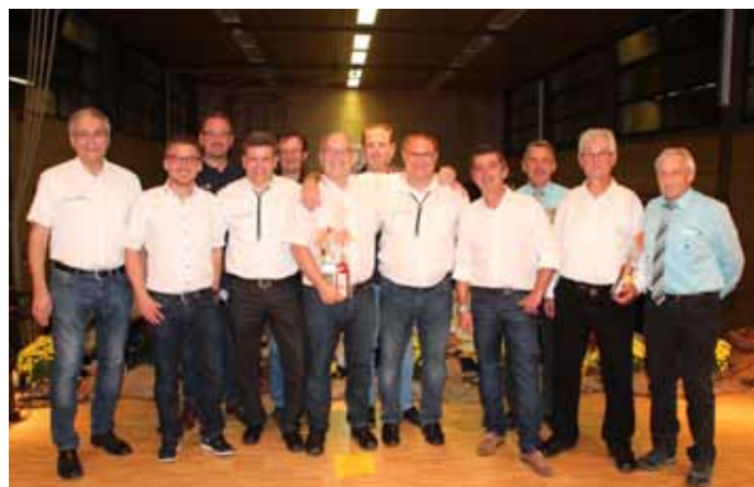
Die Chorleiter und die Vereinsvorsitzenden beim offiziellen Abschluss mit Danksagung

Am vergangenen Samstag feierte der MGVS Asbach in der Asbacher Mehrzweckhalle sein Herbstfest der Chöre. Die Männergesangvereine aus Barga, Sulzbach, Helmhof, Schollbrunn und Lobenfeld präsentierten unterhaltsame Lieder aus ihrem reichhaltigen Repertoire und trugen so zu einem gelungenen Herbstfest bei. Als Abschluss des offiziellen Teils sang der ganze Saal das Badnerlied und anschließend wurde an den Tischen noch kräftig weiter gesungen.