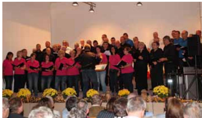
Das große Finale: Alle 3 Chöre sangen „Tage wie diese“ und „Der Bajazzo - Warum bist du gekommen?“

Vor ausverkauftem Haus präsentierten der Männergesangverein Asbach, der VOBA-Chor der Volksbank Neckartal und die Männer-A-cappella-Gruppe Isch ebbes? aus Waibstadt am vergangenen Freitag das einmalige Konzerterlebnis „Die pure Lust am Singen!“. Die Sängerinnen und Sänger begeisterten in der Asbacher Mehrzweckhalle ihr Publikum mit modernen und mitreißenden Liedern. Der Funke sprang schnell über und so konnte anschließend, selbstverständlich nach einer Zugabe, eine ausgelassene Chorparty am Weinstand und in der Sängerbar gefeiert werden.