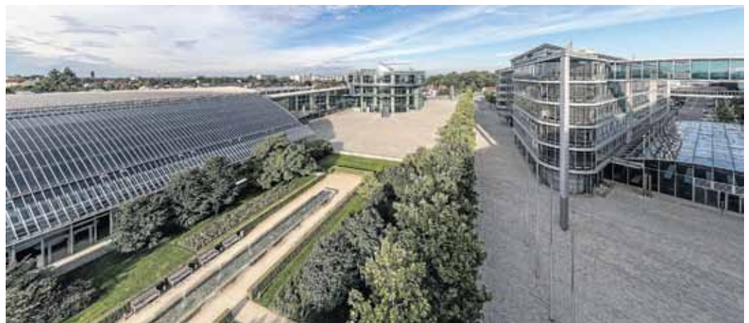
Das Audi Forum Ingolstadt

Die AUDI AG hat die Geldbuße nach eingehender Prüfung akzeptiert und wird hiergegen keine Rechtsmittel einlegen. Die AUDI AG bekennt sich damit zu ihrer Verantwortung für die vorgefallenen Aufsichtspflichtverletzungen.