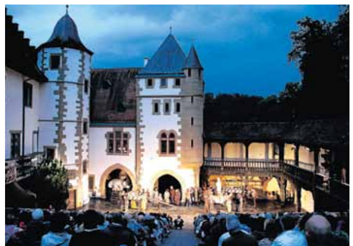
Publikum und Bühne in der Götzenburg

Karten und weitere Infos gibt es seit Montag, den 8. Oktober über das Internet www.burgfestspiele-jagsthausen.de , per Mail burgfestspiele@jagsthausen.de , per Fax 07943 912440 oder per Telefon 07943 912345