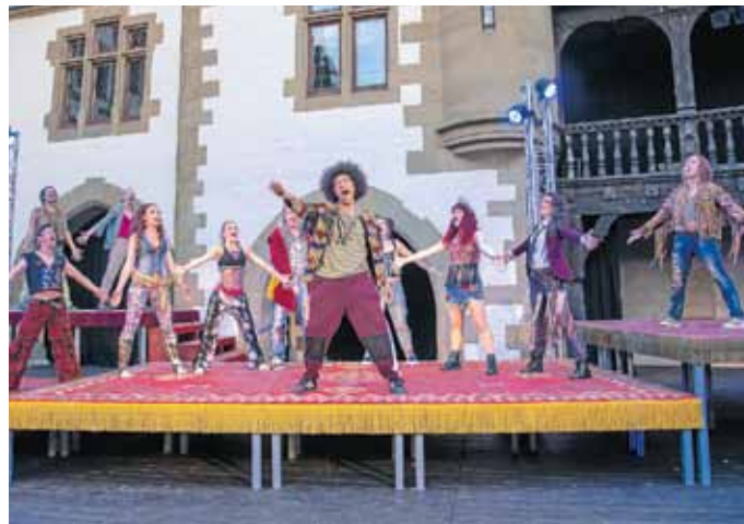
„Hair“: Let the sun shine in!

Mit „The Addams Family“ bringen die Burgfestspiele Jagst-