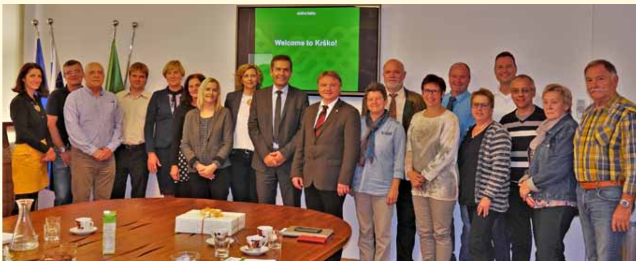
Unser Bild zeigt einen Teil der Obrigheimer Delegation zusammen mit Bürgermeister Miran Stanko und seinen Abteilungsleitern/-innen

Beim Abschied freute man sich bereits auf ein Wiedersehen im nächsten Jahr beim Obrigheimer Kiliansmarkt.