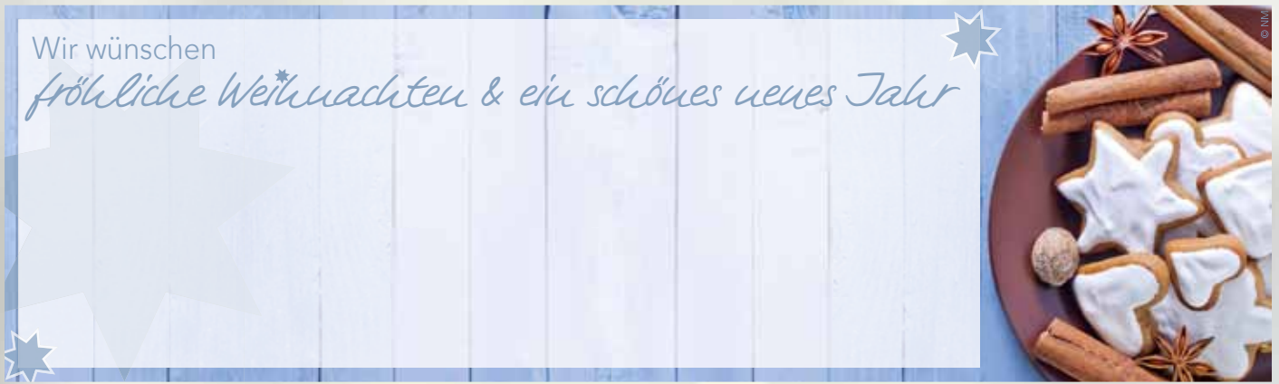
WA17_009: 4-spaltig, 55 mm