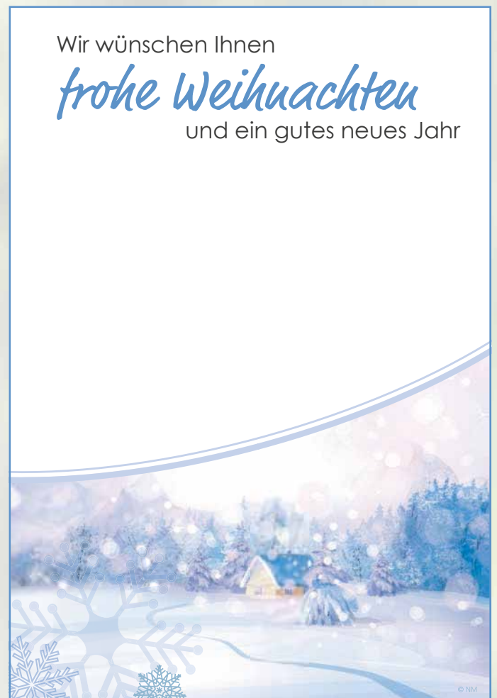
WA17_013: 2-spaltig, 130 mm