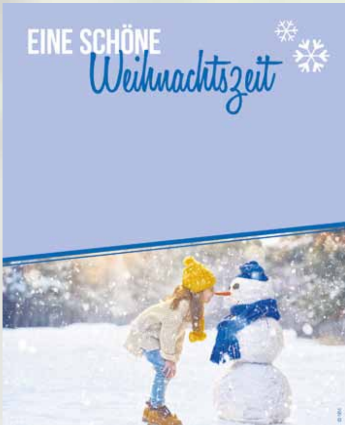
WA17_010: 2-spaltig, 110 mm