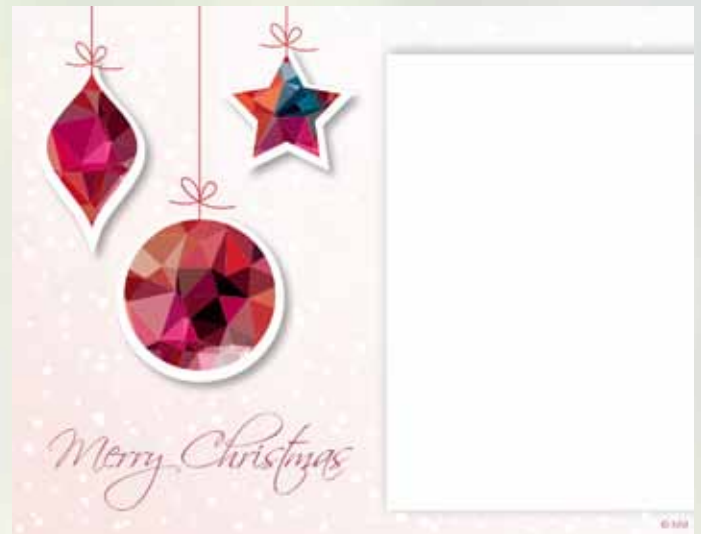
WA17_012: 2-spaltig, 70 mm