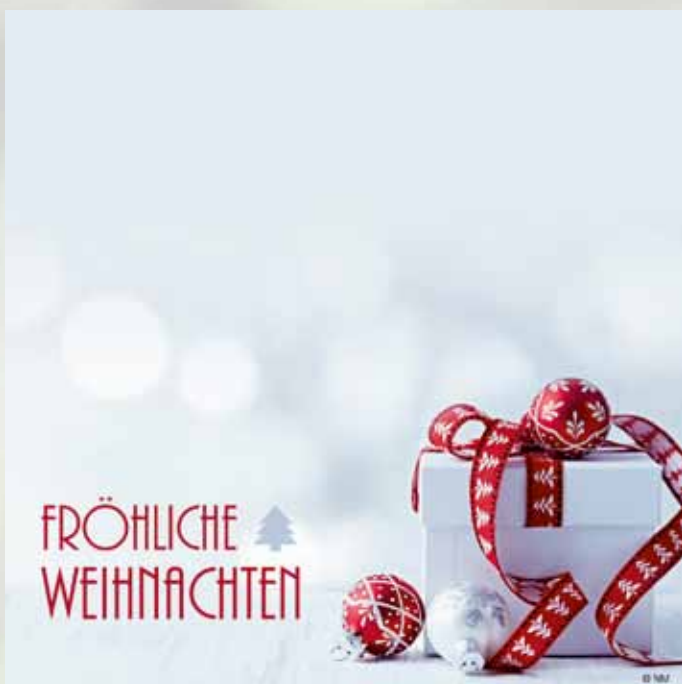
WA17_011: 2-spaltig, 90 mm