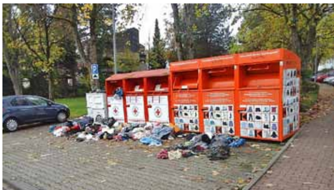
- Ende der amtlichen Bekanntmachungen -