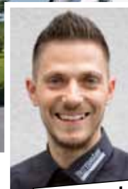
Steffen Hecht Bauelemente-Service