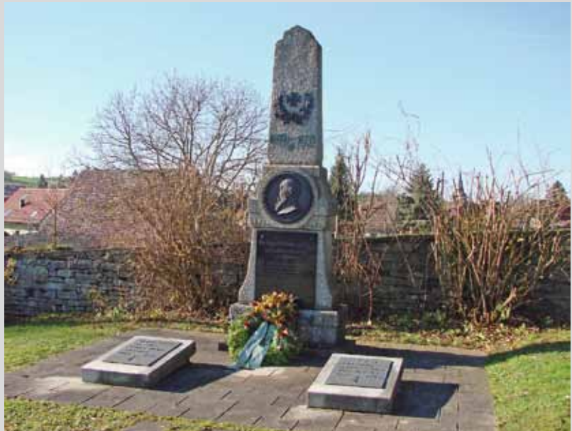
Gedenkstätte im Ortsteil Asbach

Liebe Mitbürgerinnen und Mitbürger, am kommenden Sonntag ist Volkstrauertag.