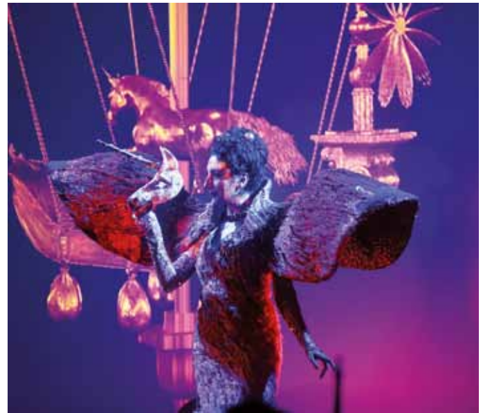
Internationale, renommierte Künstler gestalten das neue Programm mit dem Titel „Mon Amour“.