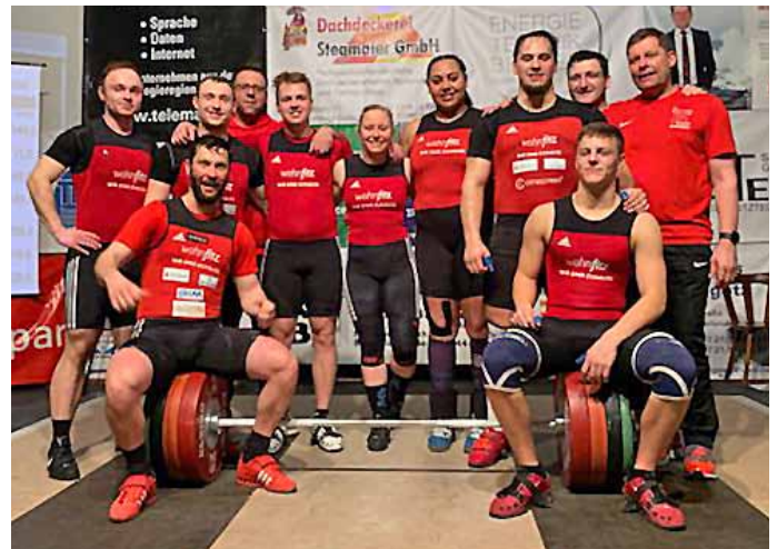
Obrigheimer Mannschaft mit Betreuern