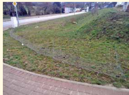
Krötenzäune Bereich Kirstetter Straße - Liebold