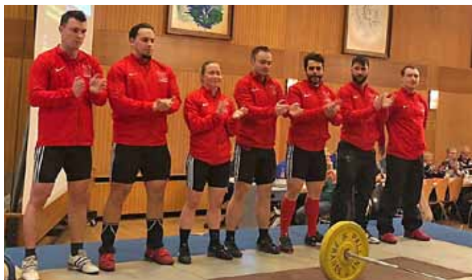
Obrigheim I in St. Ilgen erfolgreich