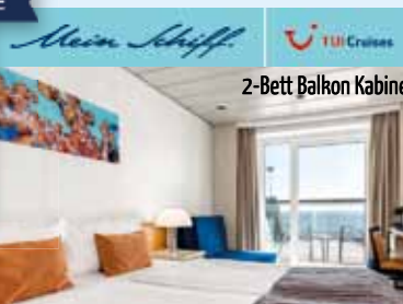
2-Bett Balkon Kabine

Kommen Sie an Bord und erleben Sie eine wundervolle Reise entlang der italienischen Mittelmeerküste. Start- und Zielhafen dieser 9-tägigen Mittelmeer-Kreuzfahrt ist Valletta auf Malta. Freuen Sie sich auf dieser Reise auf vielfältige Ziele voller Dolce Vita-Gefühl wie Porto Torres auf Sardinien, Ajaccio auf Korsika sowie La Spezia, Civitavecchia – vor den Toren der Heiligen Stadt Rom und Neapel.