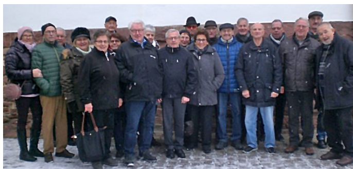
KWO-Rentner besuchten Museum