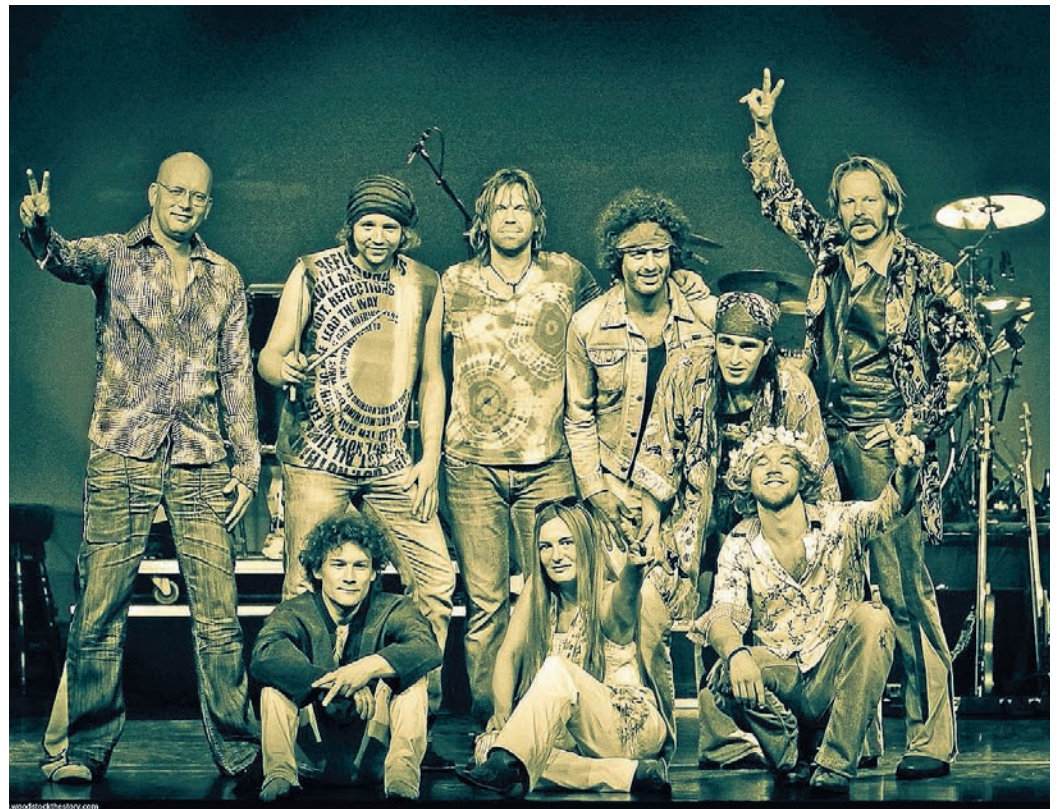
Woodstock: Love, Peace, Blumen im Haar und bunte Hemden

„Woodstock the Story - Das Rockmusical“ versetzt auf elektrisierende Weise die Besucher zurück in diese Zeit, in der Rockmusik eine neue Dimension fand. Die grandiose Musiktheaterinszenierung erzählt von