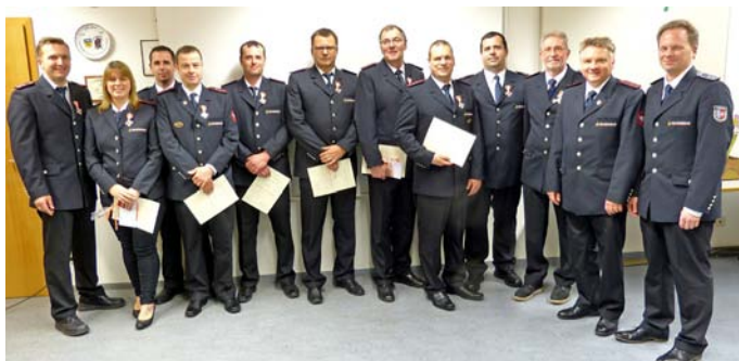
Die mit dem Ehrenzeichen in Bronze, Silber und Gold geehrten Kameraden