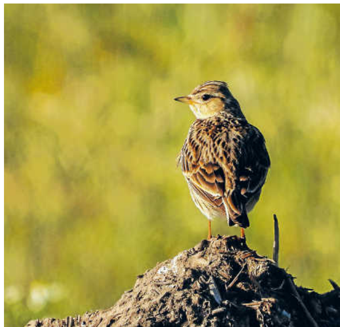
Bodenbrüter, wie die Feldlerche, sind besonders sensibel für Störungen. Die Feldlerche beginnt damit ab Mitte April mit dem Nestbau und legt dafür eine Mulde inmitten lichter Vegetation an.

In Naturschutzgebieten sind Tiere und ihre Brutstätten beson-