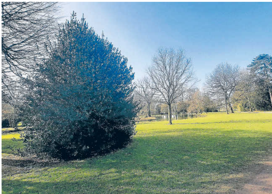
Stechpalme im Favorite-Park

Mit Palmen hat das Laubgehölz wenig gemein. Sein Name geht auf einen Brauch am Palmsonntag zurück, der auf den Einzug Jesu in Jerusalem verweist: Gottes Sohn wurde in der Heiligen Stadt der Überlieferung nach mit Palmwedeln begrüßt. Bei Prozessionen in Mitteleuropa behalf man sich mangels Palmen mit geweihten Stechpalmen-Zweigen. Zu Weihnachten und Silvester war der Ilex vor allem im 19. Jahrhundert eine äußerst beliebte Dekoration. Seit 1935 steht die wildwachsende Stechpalme in Deutschland unter besonderem Schutz: Sie darf weder kommerziell noch privat geschnitten oder ausge-