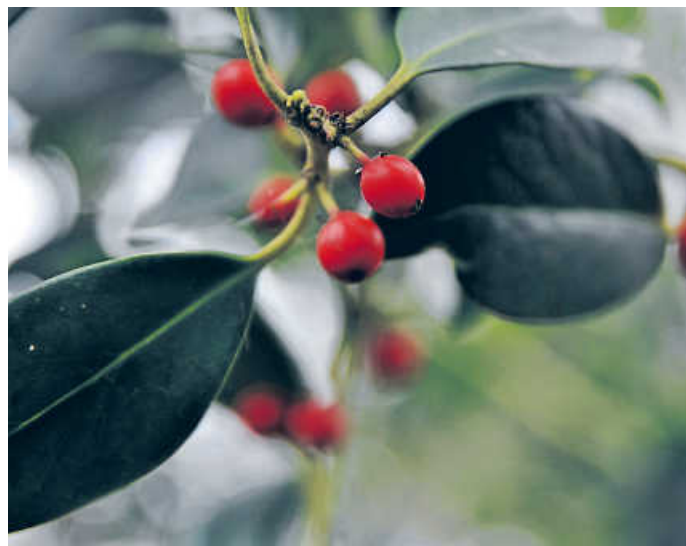
Zwischen den immergrünen stacheligen Blättern leuchten die roten Früchte hervor.

war diese Art von Vegetation auf dem damals deutlich wärmeren Kontinent weit verbreitet – und mit ihr die Stechpalme. An das nach und nach kälter werdende Klima konnte sich die Pflanze an günstigen Standorten anpassen. Ihr heutiges natürliches Verbreitungsgebiet ist das vom Atlantik beeinflussten Westeuropa, gekennzeichnet durch milde feuchte Winter und nicht zu trockene Sommer.