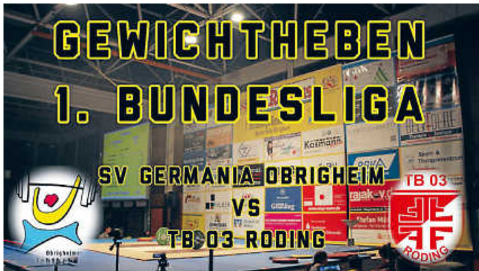
1. Bundesliga 8.5.2021

Wir freuen uns darauf, möglichst bald wieder Zuschauer in der Halle begrüßen zu dürfen.