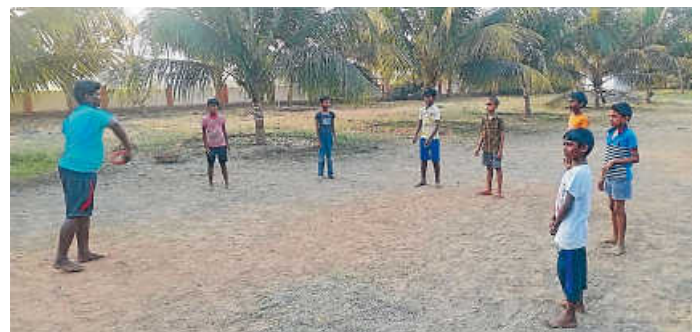
Die Kinder sind gesund und munter - es gibt noch keine Corona-Fälle

Die Kinder sind gesund und munter, es gibt bis jetzt Gott sei Dank noch keinen positiven Corona-Test. Damit dies so bleibt, werden sie derzeit nicht mehr in die öffentliche Schule geschickt. Seit dieser Woche pausiert außerdem der Schulbetrieb im Land.