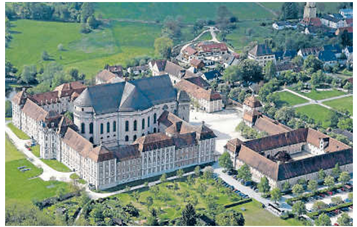
Das eindrucksvolle Ensemble von Kloster Wiblingen

Kurz vor der Säkularisation erlebte Kloster Wiblingen eine letzte Blüte: Die Klosterschule