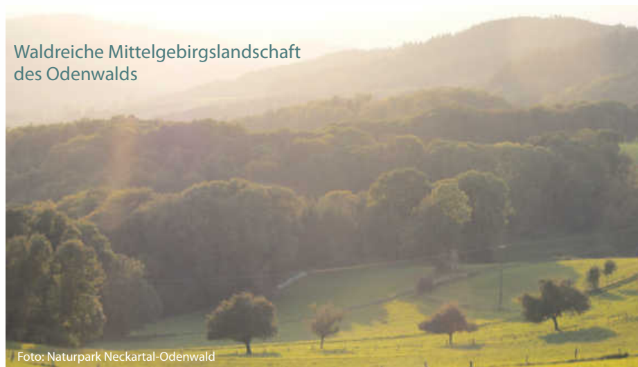
Waldreiche Mittelgebirgslandschaft des Odenwalds

Die Naturparke nehmen über 36 Prozent der Landesfläche von Baden-Württemberg ein. Als Großschutzgebiete erhalten sie die facettenreichen Kulturlandschaften im Einklang von Menschen, Tieren und Pflanzen. 431 Kommunen in 37 Stadt- und Landkreisen sowie zahlreiche Vereine, Verbände und Ehrenamtliche engagieren sich in den Naturparks und wirken in deren Entscheidungsgremien und Netzwerken mit. Auf diese Weise wird mit allen Interessengruppen die Zukunft der ländlichen Regionen gestaltet. Inhaltliche Schwerpunkte sind die Aufgabenfelder Naturschutz und Landschaftspflege, Erholung und nachhaltiger Tourismus, Bildung für nachhaltige Entwicklung sowie nachhaltige Regionalentwicklung.