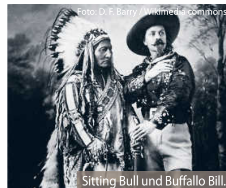
Sitting Bull und Buffalo Bill.

dazwischen fanden Pressetermine und Treffen mit berühmten Persönlichkeiten statt. In Rom wurde Buffalo Bill beispielsweise von Papst Leo XIII. empfangen. Ausflüge der Darstellerinnen und Darsteller in ihren Kostümen waren weitere werbewirksame Maßnahmen. Die weltberühmte Sehenswürdigkeit in der Nachbarstadt ihres Auftrittsortes wollten sich die Darsteller nicht entgehen lassen. Buffalo Bill und ein Teil seiner Truppe besuchten Schloss Heidelberg am 27. April 1891. Dass das Schloss Heidelberg ein „Must“ war, hatte mit einem anderen US-Amerikaner zu tun: Ein paar Jahre zuvor hatte Mark Twain die faszinierende Schlossruine in seiner Heimat berühmt gemacht. In seinem „Bummel durch Europa“ (1880) hatte der „Vater der amerikanischen Literatur“ Schloss Heidelberg und der Stadt am Neckar ein literarisches Denkmal gesetzt – und viel dazu beigetragen, das Schloss am Neckar zum Top-Ziel amerikanischer Touristen zu machen.