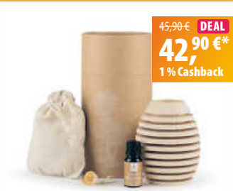
LivingDesigns Dufftholz Zirbe „globe“