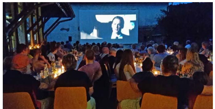
Sommerkino vor dem Gemeindehaus in Mörtelstein

Der Film startet um ca. 21.15 Uhr als „Sommer-Open-Air-Kino“ auf der Großleinwand im Hof des Gemeindehauses. Bei schlechtem Wetter zeigen wir den Film im Gemeindehaus. Der Eintritt ist frei.