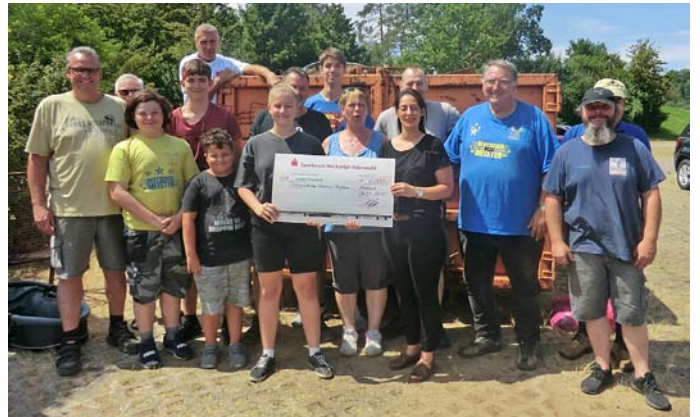
Erfolgreiches Sammelfinale der Gewichtheber

Helferinnen und Helfern, die tatkräftig zum erfolgreichen Gelingen der Aktion beigetragen haben sowie bei all denen, die die Sammlung mit der Abgabe von Altmittel unterstützt haben. Ein großer Dank auch der KWO-Geschäftsleitung, die über mehrere Monate ihren Parkplatz als Standort für den Container zur Verfügung gestellt hat. Franz Hauß