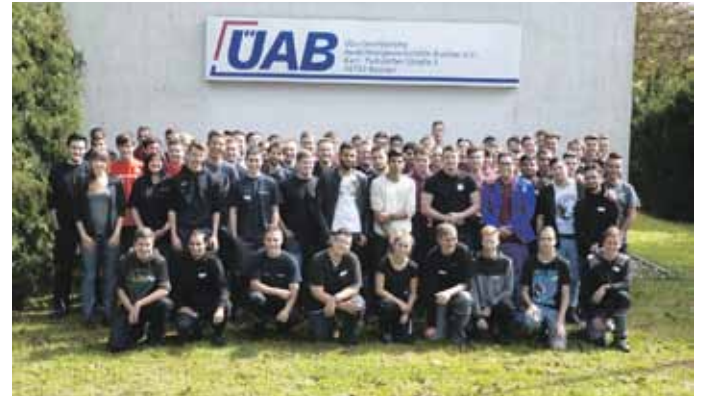
Die neuen Auszubildenden des Ausbildungsjahres 2017/18.

gen Weiß. Ein ÜAB-Teamtraining zum Ausbildungsbeginn fördert diese Fähigkeiten. Beste Bedingungen also für die neuen Auszubildenden, sich in ihren Berufen zu qualifizieren und damit die Basis für einen erfolgreichen Abschluss ihrer Ausbildung zu legen.