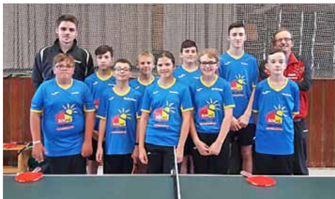
Schülermannschaft der Abteilung Tischtennis SVO mit neuen Trikots

Nachdem die Tischtennisabteilung in der zurückliegenden Saison 2016/2017 keine Schüler- oder Jugendmannschaft im Tischtennisbezirk Mosbach mangels vorhandener Spieler/-innen melden konnte, sieht dies in der neuen Saison 2017/2018, welche im September begann, dank etlicher neuer Mitglieder, die auch am Spielbetrieb interessiert sind, wieder besser aus.