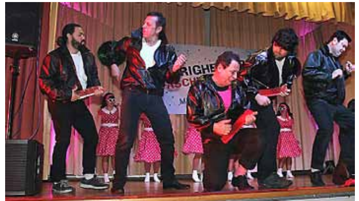
Das Männerballett in Aktion