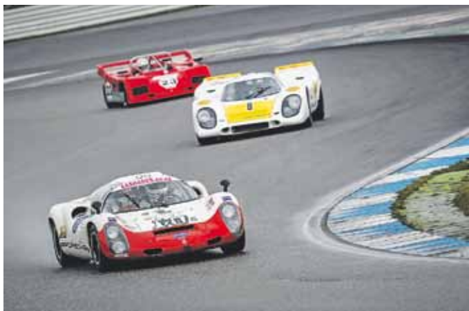
Vom 21. bis 23. April können Rennsportfans bei der „Bosch Hockenheim Historic“ klassische Rennserien hautnah erleben.

Hockenheim. (pm/red). Die „Bosch Hockenheim Historic“ ist ein Fest der Sinne für die Zuschauer: mit freiem Zugang zu Fahrerlager und Boxen, faszinierenden historischen Rennwagen, Spektakel auf der Rennstrecke und Party auf dem Boxendach. Die Atmosphäre ist familiär, das Rahmenprogramm sensationell und die Eintrittspreise moderat: Hereinspaziert zur „Bosch Hockenheim Historic“ - dem Jim Clark Revival - von 21. bis 23. April auf dem Hockenheimring.