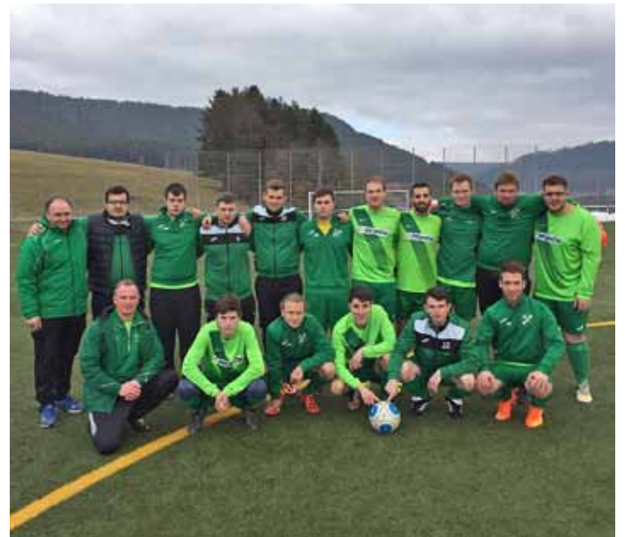
Mannschaftsfoto vor dem Trainingsauftakt