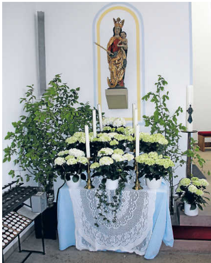
Maialtar in Asbach