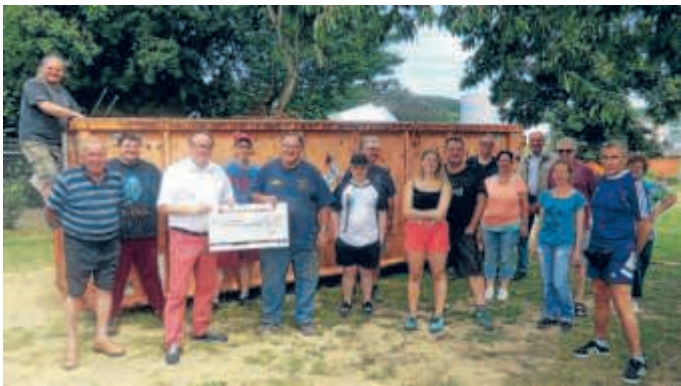
Scheckübergabe durch die Fa. Inast