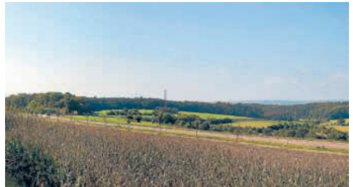
Blick von der Gichtbühne auf den Katzenbuckel

HVO-Vorsitzender Nesper bittet die Mitbürger/-innen, diese Information im Bekannten- und Freundeskreis zu streuen, sich über die Adresse fotowettbewerb.geo-naturpark.net einzuwählen und abzustimmen. Er empfiehlt das Landschaftsfoto mit Blick auf den Katzenbuckel zu wählen, da man nur eine Stimme hat. Machen Sie daher mit und geben Sie dem Mörtelsteiner Kalkofen Ihre Stimme. Besten Dank im Voraus.