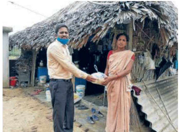
Die jüngste Hilfsaktion fand im Dorf Atreyapuram statt. Hier wird ein Hilfspaket an einer ärmlichen Hütte übergeben.