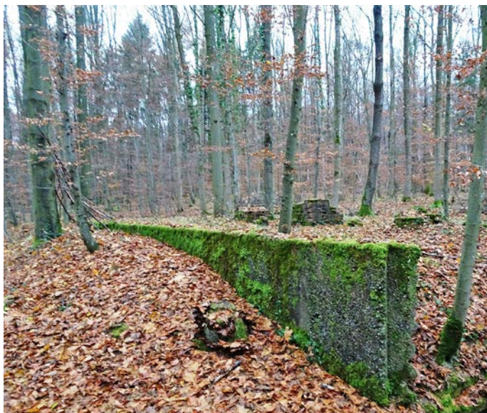
Reste von Barackenfundamenten im Hönigwald