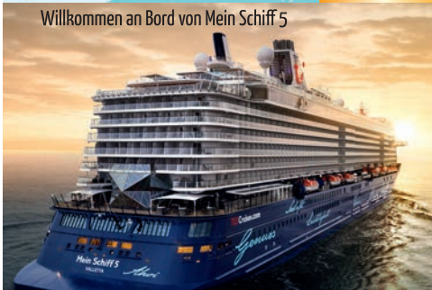
Willkommen an Bord von Mein Schiff 5