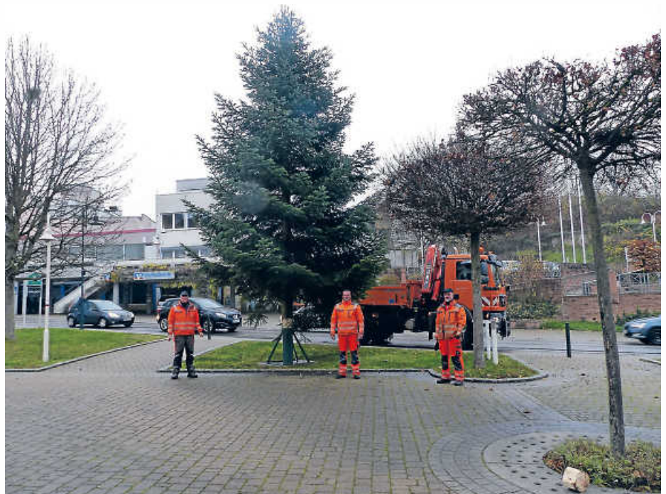
Unser Bild zeigt die drei Bauhofmitarbeiter nach getaner Arbeit vor dem aufgestellten Weihnachtsbaum beim Rathaus.

Bürgermeister Achim Walter sowie die gesamte Gemeindeverwaltung wünschen allen Bürgerinnen und Bürgern eine besinnliche Vorweihnachtszeit.