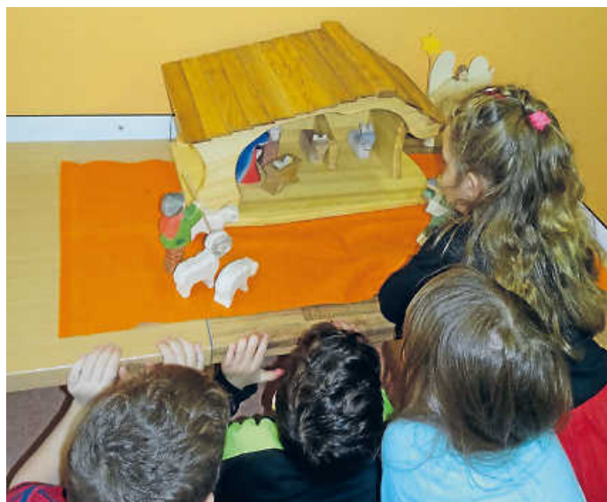
Die Weihnachtszeit kann kommen: Durch einen Aufruf des Elternbeirats konnten die Weihnachtsskrippen beschafft werden.

Wir wünschen allen eine schöne und besinnliche Adventszeit.