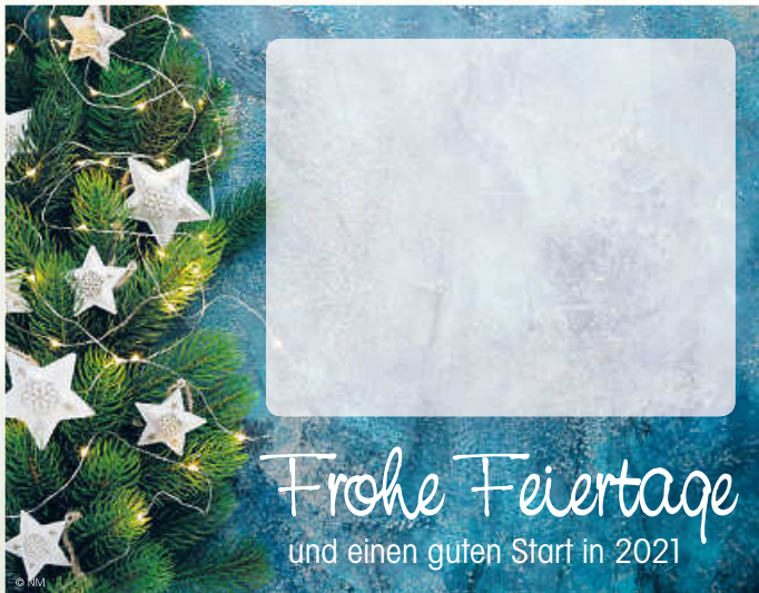
WA20_015: 2-spaltig, 70 mm