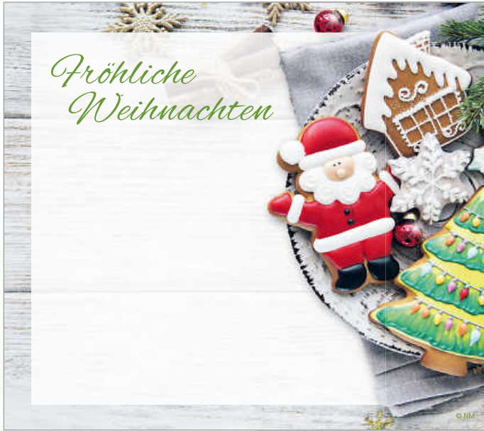
WA20_040: 2-spaltig, 90 x 55 mm - Maler