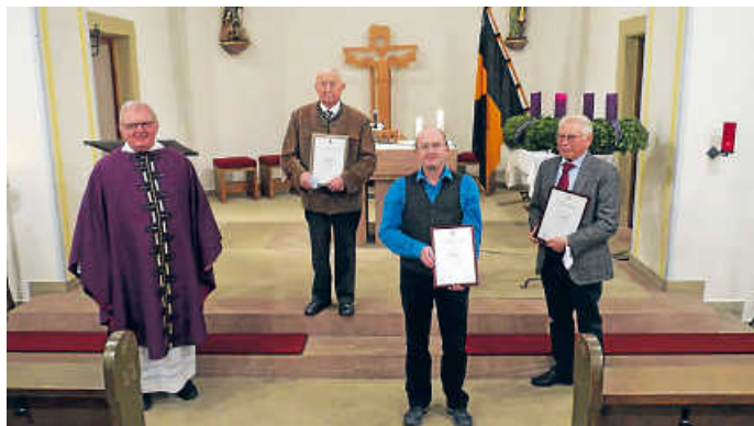
Unser Bild zeigt die geehrten Mitglieder der Kolpingsfamilie zusammen mit Pfarrer Dorbath.