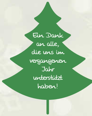
Symbol_005 mit Text_011