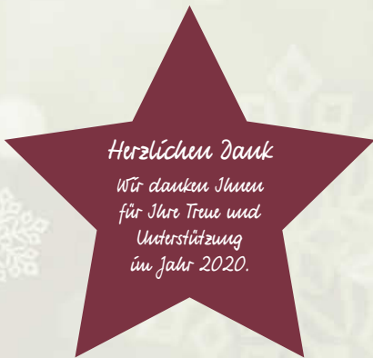
Symbol_001 mit Text_007