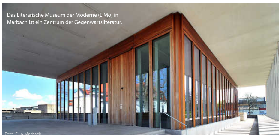
Das Literarische Museum der Moderne (LiMo) in Marbach ist ein Zentrum der Gegenwartsliteratur.

Ob Klassiker oder Bestseller, historische Manuskripte oder Poetry-Slams – Baden-Württemberg zeigt, dass Literatur hier nicht nur geschrieben, sondern gelebt wird. (jr)