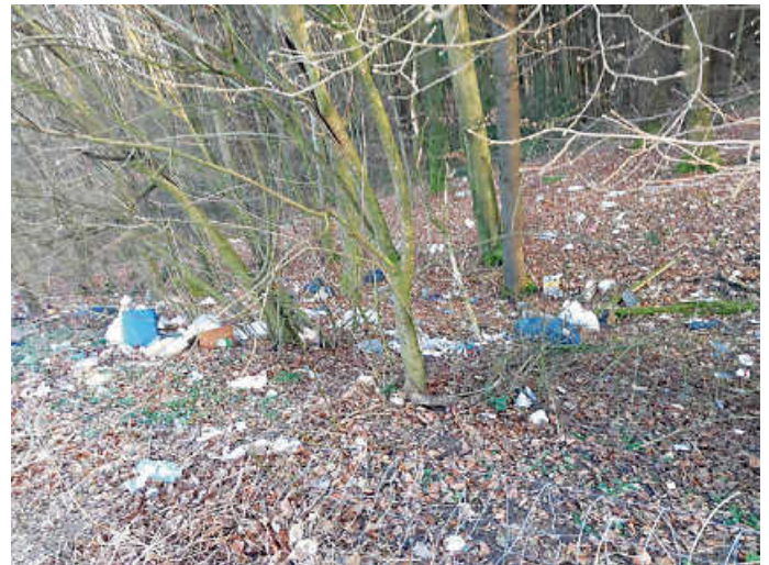
Müll im Wald beim unteren Hohberg-Parkplatz an der B292, Obrigheim

Die naturnahe und nachhaltige Bewirtschaftung des Staatswaldes durch Forst Baden-Württemberg, AöR ist FSC C120870 und PEFC zertifiziert. Seit dem 1. Oktober 2020 trägt ForstBW zudem das Gemeinwohl-Ökonomie-Zertifikat.