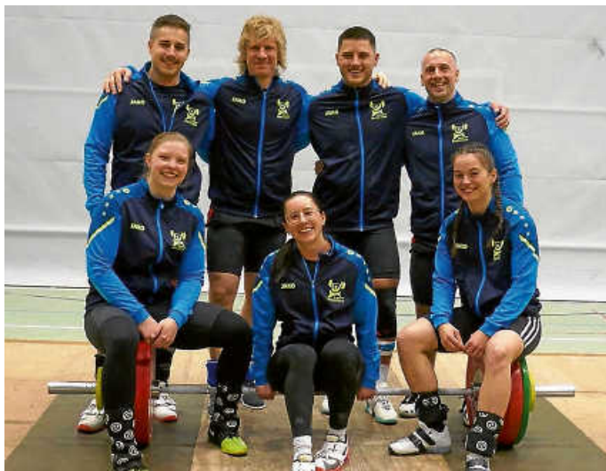
Die Sieger gegen Fellbach