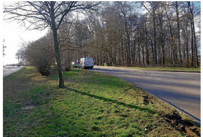
Oberer Hohberg-Parkplatz B292, Obrigheim